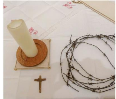
So viel durfte ich am Altar ablegen.