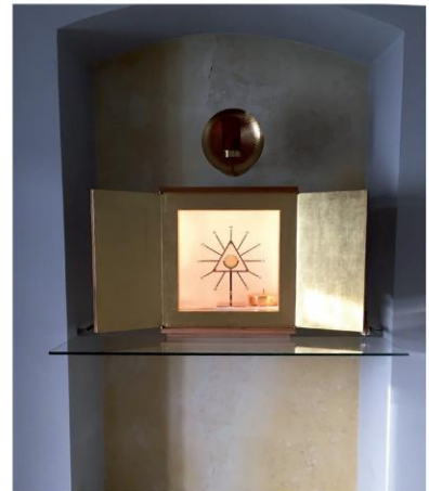
Ich durfte mich finden lassen von dir, mein Gott... Ich war zu Hause, als du kamst.