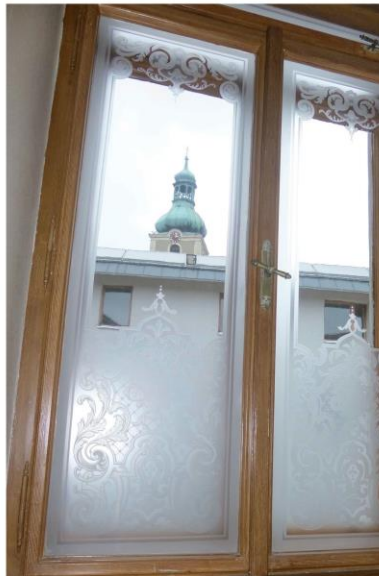
Neue Ein- und Durchblicke wurden mir geschenkt.