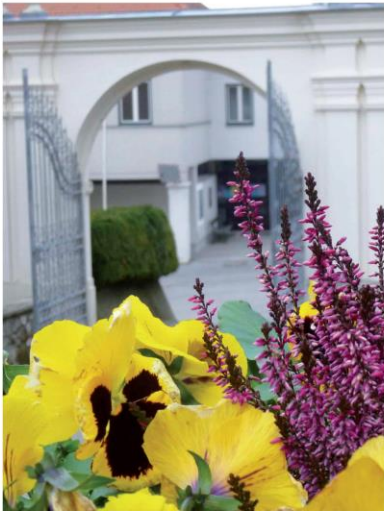
Drei Tage in Großrußbach haben mein Leben verändert... Der Heilige Geist kam und entzündete in mir das Feuer Seiner Liebe.