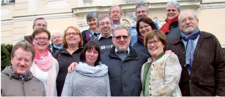
Wir durften miteinander Glauben erleben.