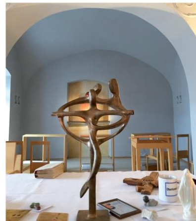
Drei Tage in Großrußbach haben mein Leben verändert. Der VIERTE ist jeden Tag aufs Neue eine GÖTTLICHE FÜGUNG .