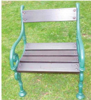
Menschen, die ich vorher nicht kannte, waren mir von Anfang an vertraut... Herr, mein Vertrauen zu dir ist nun grenzenlos.